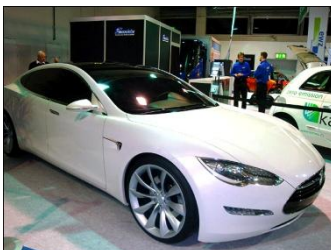
Auto Zürich: Tesla S bei e'mobile