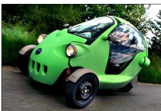
Neu in der Schweiz erhältlich: SAM EV II

Was kann «Freude am Fahrzeug» in Zukunft aus gestalterischer und konzeptioneller Sicht bedeuten, wenn Automobile kleiner, leichter und effizienter werden? Diese Frage stellt sich Marcel Gnos im Rahmen seiner Masterarbeit als Industrial Designer an der Zürcher Hochschule der Künste (ZHdK). In einem ersten Schritt soll anhand einer Online-Umfrage herausgefunden werden, was die Freude am Fahrzeug heute ausmacht. Diese richtet sich hauptsächlich an Personen zwischen 20 und 31 Jahren, die ein eigenes Auto besitzen oder bis vor kurzem eines besessen haben.