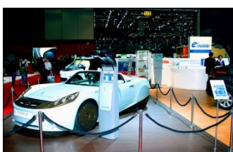
e'mobile am Autosalon Genf

Wie und wo werden die Batterien der Elektrofahrzeuge in Zukunft aufgeladen und woher kommt die dafür nötige Elektrizität? Dies sind Fragen, die in den letzten Monaten oft gestellt wurden. Am kommenden Automobilsalon in Genf vom 4. bis 14. März 2010 sind auf dem Stand Nr. 5141 vom Verband e'mobile mögliche Antworten darauf ein zentrales Thema. Passend dazu sind drei Elektrofahrzeuge ausgestellt, darunter eine Weltpremiere. Zu sehen sind zudem die beiden Marktführer in der Schweiz unter den Hybridfahrzeugen. Der Stand ist auch zentrale und neutrale Ansprechstelle für Fragen zu neuen Antriebskonzepten und alternativen Treibstoffen, zur EnergieEtikette und zum Programm EnergieSchweiz vom Bundesamt für Energie.