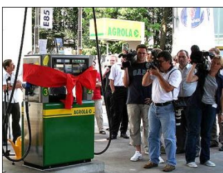
Eröffnung einer E-85-Tankstelle in Winterthur

Treibstoffe wie Bioethanol, Biodiesel oder Biogas, die aus erneuerbaren Rohstoffen stammen, werden seit dem 1. Juli 2008 von der Mineralölsteuer befreit, sofern sie die minimalen ökologischen und sozialen Anforderungen erfüllen. Die für den Nachweis nötigen Unterlagen hat der Treibstoffanbieter zu liefern.