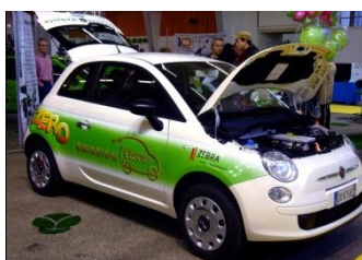
VEL EXPO TICINO 2009

Die Organisatoren von IAMF wollen vor allem den Erfahrungsaustausch und Dialog zwischen den verschiedenen Fachleuten fördern. Neben Präsentationen findet deshalb auch ein Rundtischgespräch zur Markteinführung von Elektro- und Plug-in-Hybrid-Fahrzeugen statt. In der Dialogsession am Mittwoch während der Mittagspause stellen um die 30 Fachpersonen ihre Forschungsarbeiten und neusten Erkenntnisse vor. Schliesslich werden in der Abschluss-session, die eintrittsfrei allen Automobilsalon-Besuchern zugänglich ist, die wichtigsten Trends und Erkenntnisse des Forums zusammengefasst.