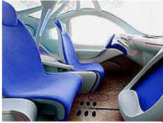
Elektromobilität eröffnet neue Perspektiven