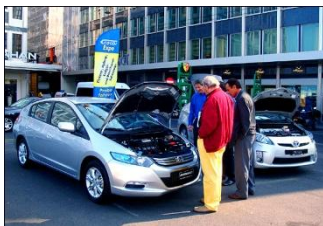
Ecocar-Expo in Genf

Die Elektrizitätswerke des Kantons Zürich (EKZ) stellen von Adliswil bis Turbenthal und Zürich zwölf Ladestationen nach dem System Park & Charge für strombetriebene Fahrzeuge in ihrem Versorgungsgebiet auf. In den EKZ-Ladestationen sind je vier Steckdosen montiert. Hier können die Batterien von Elektromobilen je nach Anschluss in vier bis acht Stunden ganz einfach aufgeladen werden. Ferner bieten sich die EKZ auch als Berater etwa bei der Wahl der richtigen Steckdose zu Hause an und geben ihre Erfahrungen mit der eigenen Testflotte an ihre Kunden weiter.