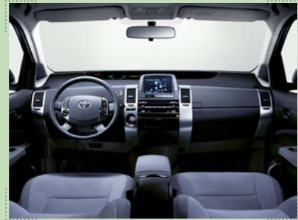
Das Interieur des Toyota Prius II