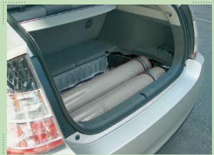
Platzierung der Erdgastanks