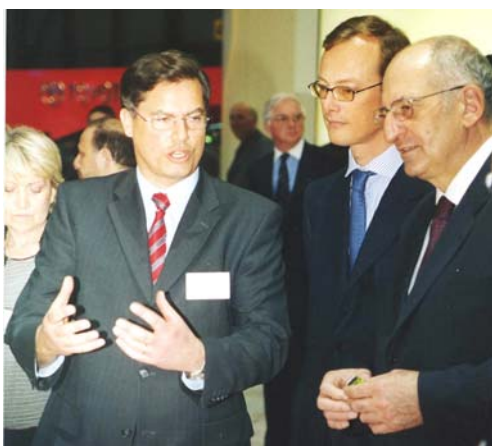
Bundespräsident Pascal Couchepin liess sich auf dem Eröffnungsrundgang durch den Autosalon von René Bautz, Präsident von e'mobile, das Konzept des EcoCar-Stands erklären.

Angenommen, dass 60% der Beratenden und 5% der anderen Standbesucher ein effizientes Fahrzeug kaufen, das einen um 1,6 l Benzin pro 100 Kilometer tieferen Treibstoffverbrauch hat, ergeben dies bei einer Jahresfahrleistung von 15'000 Kilometer Einsparungen von jährlich 324'000 Liter Benzin respektive 3'240'000 kWh pro Jahr. Weitere Einsparungen sind durch die erreichten Multiplikatoren wie Garagisten, Medienschaffende, Behördenmitglieder, Flottenbesitzer, Politiker/-innen und Lehrer/-innen zu erwarten, die den Stand besucht haben. Insgesamt können die Einsparungen auf 400'000 Liter Benzin geschätzt werden.