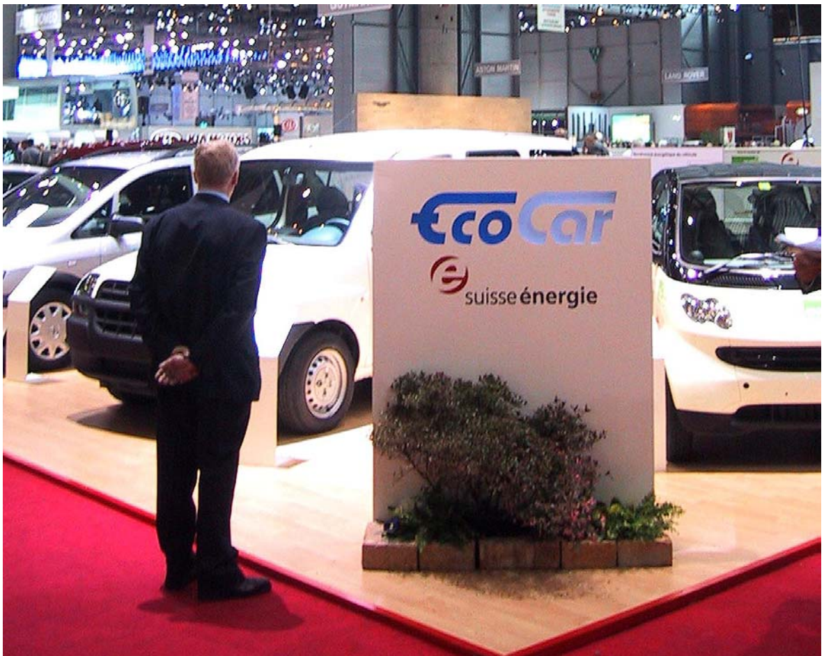
Am Autosalon in Genf 2003 konnten e'mobile und seine Partner erstmals an einem Multimarken-Stand in einer der Haupthallen eine Auswahl von effizienten Fahrzeugen zeigen.